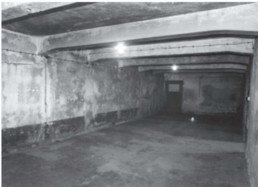
Auschwitz, poln. Oswiecim (Polen), Gaskammer im ehemaligen Konzentrationslager Auschwitz. Foto 1995.

zum Nachdenken, sie handelten automatisch wie Maschinen. Weiterhin führten die Deutschen im Laufe der Zeit ein System der Bevorzugung der Sonderkommando Häftlinge ein. Ihre Arbeitsmotivation sollte durch eine überdurchschnittlich gute Versorgung mit Kleidung und Nahrung gehoben werden. Die entscheidenden Tätigkeiten im Mordprozess, die am ehesten hätten Widerstand hervorrufen können, führten die Deutschen stets selbst aus: Den Transport der Opfer zur Gaskammer, den Einwurf des tödlichen Gases sowie das Anzünden des Feuers in den Gruben.